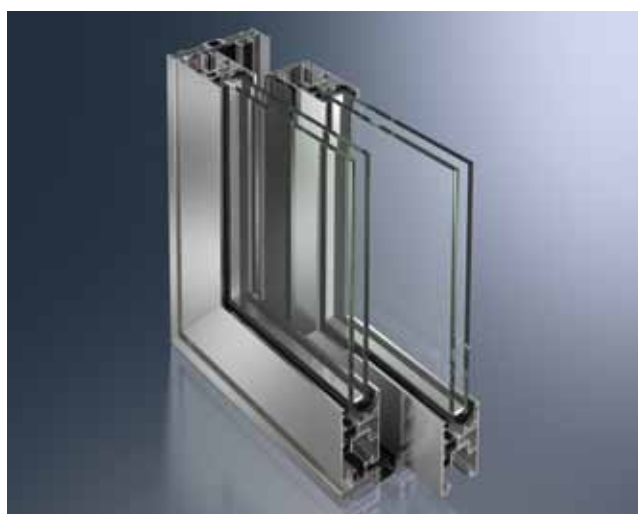
Schuifdeur Schüco ASS 50 Coulissant Schüco ASS 50